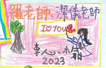
春季旅行-大埔海濱公園